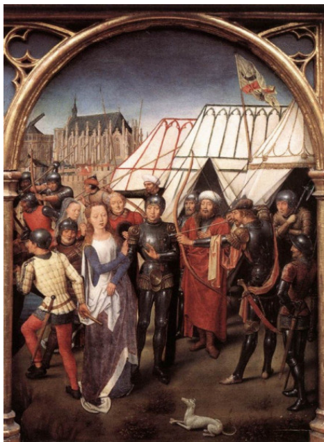
Hans Memling: Szent Orsolya mártírhalála (1489 körül)

A szárnyas oltárokon való ábrázolása (főként német területről) egész Európában elterjedt. Tűskés A. kutatásai és tanulmánya szerint Szent Orsolya megjelenik a széki református templom mellékszentélyében, ahol a legenda két jelenete látható (1360–1370), valamint az almakeréki evangélikus templomban szentélyének freskóján (14. sz.), ahol a szentély boltcikkelyeiben női szentek köztük Szent Orsolya ülő alakja jelenik meg. A felvidéki Torna