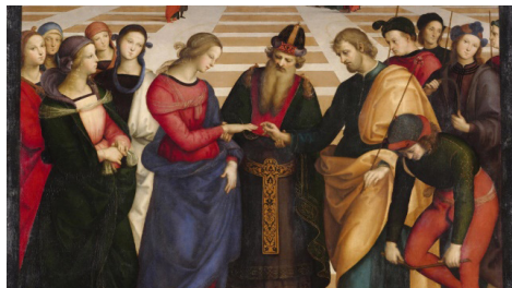
Raffaello: Lo Sposalizio della Vergine

József alakja feltűnik ugyan a középkori művészeti alkotásokon, de csak a háttérben, szinte mellékszereplőként. A reneszánszban, barokkban már méltó kifejezésre talál, számos képzőművészeti alkotás témáját képezi. Raffaello, a kor kiemelkedő művésze, 1504-ben festette a Mária és József eljegyzését ábrázoló oltárképet a Cittá di Castelló-i Szent Ferenc-templom, Albizzini-család kápolnájába.