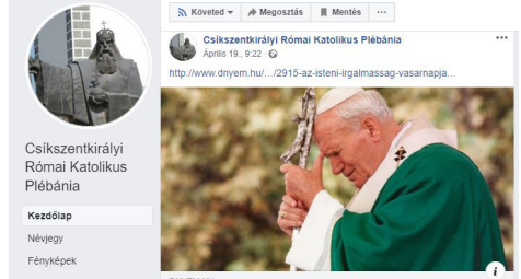
A csíkszentkirályi plébánia egyik áprilisi bejegyzése

A helyi közösség számára fontos információk, tudnivalók elérhetőek mindenki számára a plébánia Facebook oldalán, de a járvány okozta nehézségek miatt már a szentmiséket is lehet online követni. Mindenképp fontos megemlíteni, hogy több hasznos és lelkiileg is pluszokat nyújtó bejegyzést tekinthetünk meg napról napra, valamint akár a szentmisek sorrendjét is megtalálhatjuk. Tervek szerint nemsokára a plébánia honlapja is elkészül, ami szintén egy nagyon fontos kommunikációs platform lehet a közösség életében. Összegzőként elmondhatjuk, hogy az utóbbi évtizedekben nagyon pozitív irányba mozdult el az Egyház és média kapcsolata, ez pedig